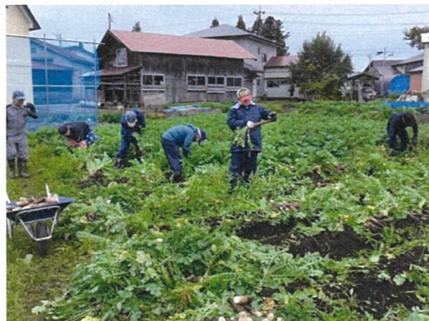
働き手の確保と規模拡大への期待