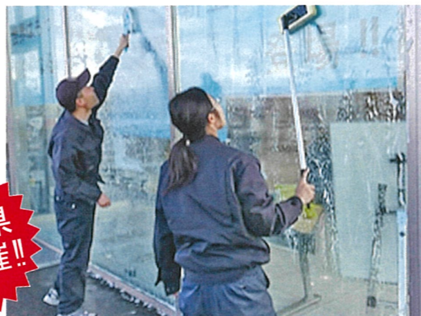
迅速・丁寧な取り組み

■実施主体 秋田県健康福祉部 障害福祉課 〒010-8570 秋田市山王四丁目 1-1 地域生活支援班 TEL:018-860-1332 FAX:018-860-3866 ■運営主体 秋田県社会就労センター協議会 〒010-0922 秋田県秋田市旭北栄町 1-5 TEL:018-864-2715 FAX:018-864-2877