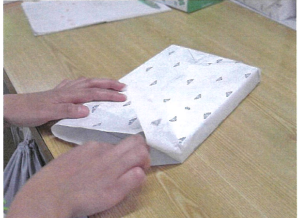
正確な作業と確実な納期