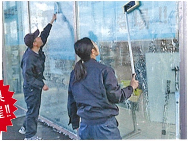
迅速・丁寧な取り組み

この機会にご質問・ご相談ください。また、取引先の開拓や情報収集にもご活用ください。