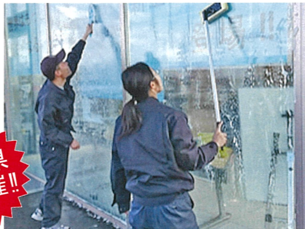
迅速・丁寧な取り組み

■実施主体 秋田県健康福祉部 障害福祉課 〒010-8570 秋田市山王四丁目 1-1 地域生活支援班 TEL:018-860-1332 FAX:018-860-3866 ■運営主体 秋田県社会就労センター協議会 〒010-0922 秋田県秋田市旭北栄町 1-5 TEL:018-864-2715 FAX:018-864-2877