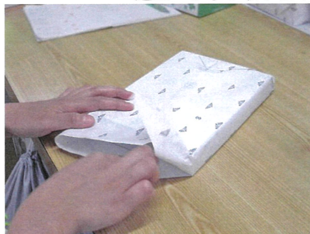
正確な作業と確実な納期