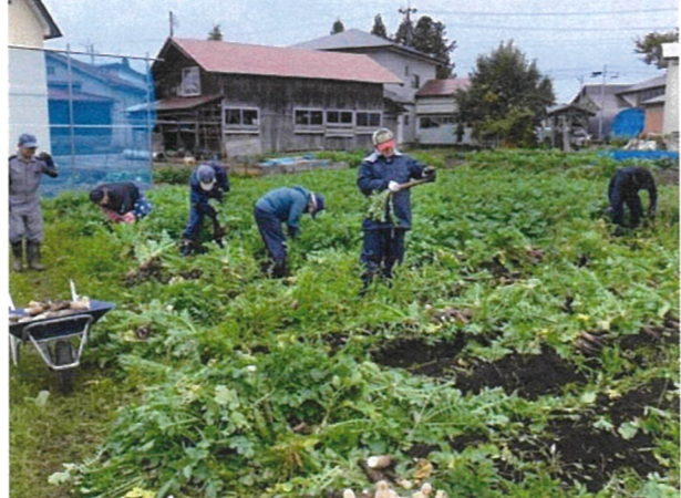
働き手の確保と規模拡大への期待