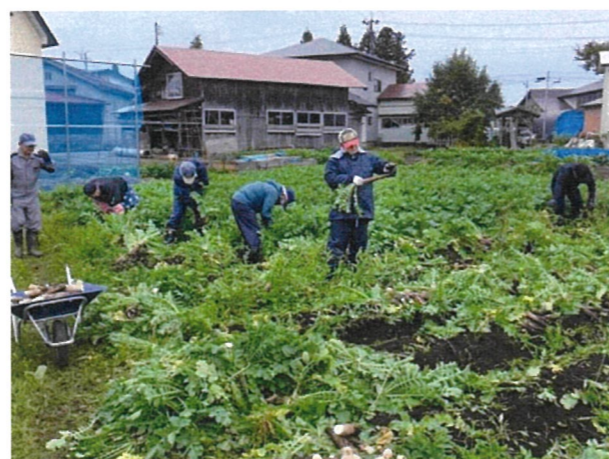
働き手の確保と規模拡大への期待